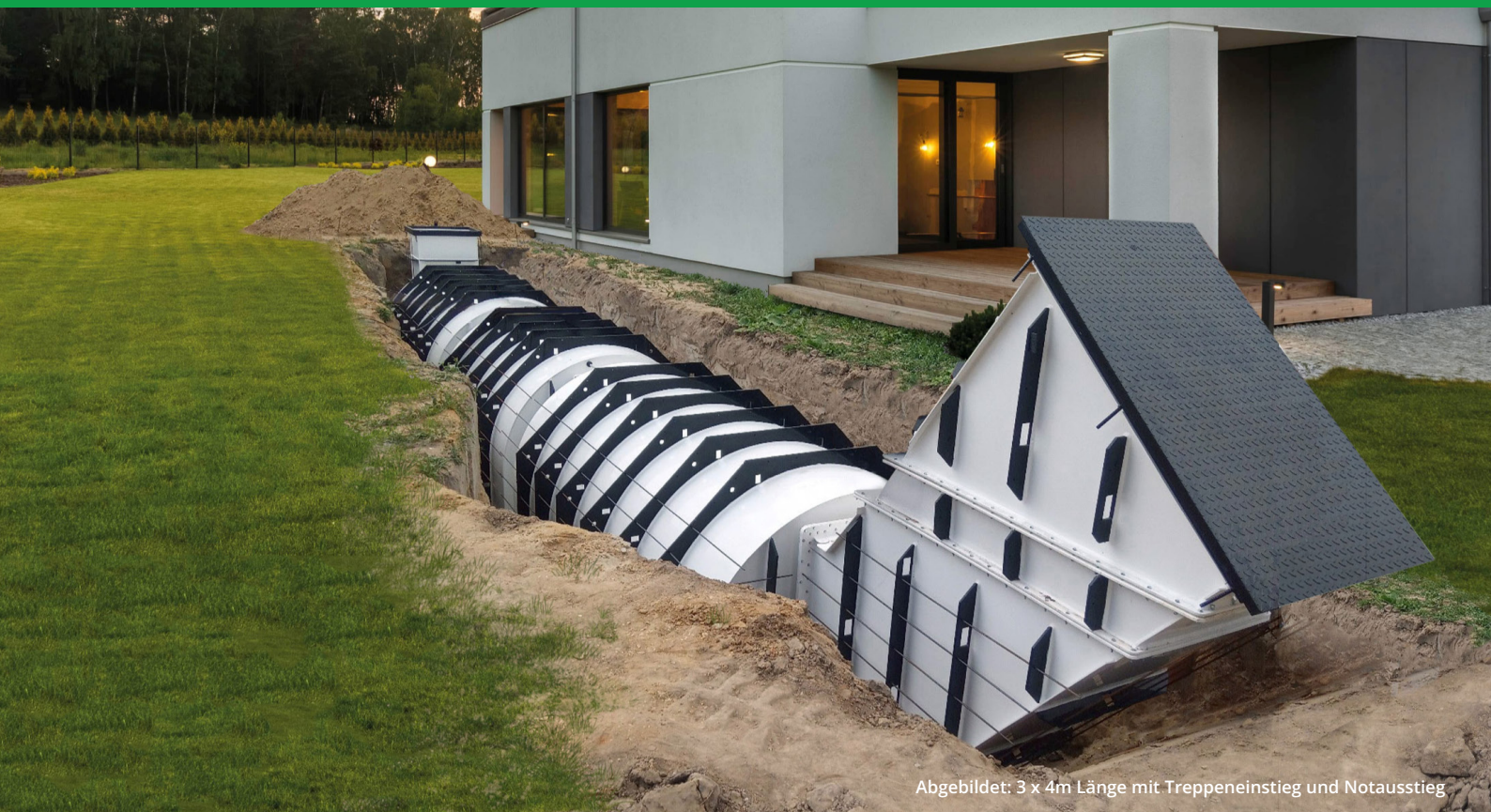
Abgebildet: 3 x 4m Länge mit Treppeneinstieg und Notausstieg

Vorgefertigt und individuell kombinierbar