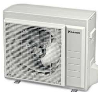
RAL 9016 Verkehrsweiß