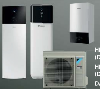
HPSU Bi-Bloc Ultra (DAIKIN Altherma 3 R W) HPSU compact Ultra (DAIKIN Altherma 3 R ECH 2 O) DAIKIN Altherma 3 R F