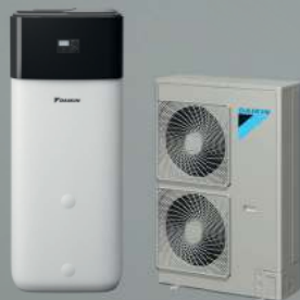
HPSU compact (DAIKIN Altherma R ECH 2 O)