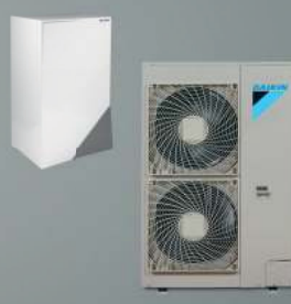
HPSU Bi-Bloc (DAIKIN Altherma R W)