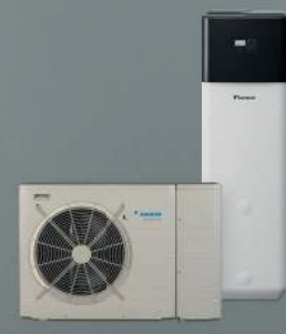
HPSU monobloc compact (DAIKIN Altherma M ECH 2 O)