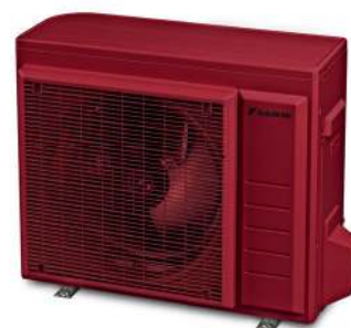
RAL 3003 Rubinrot

Hinweis: Serienlackierung Außengeräte in Elfenbein.