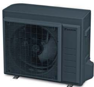
RAL 7016 Anthrazitgrau