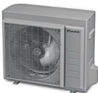
RAL 9006 Weißaluminium